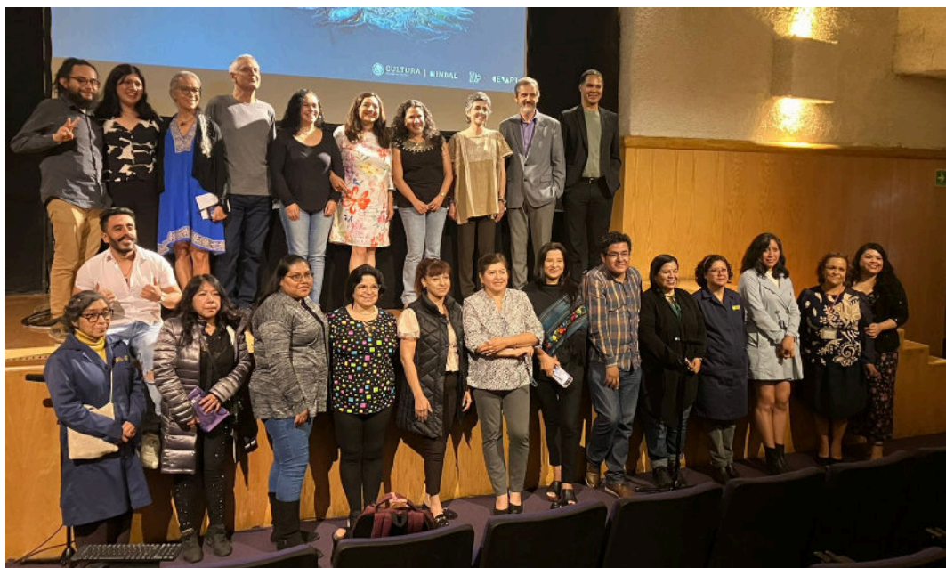
Clausura del II Encuentro Internacional de Investicreación y Formación Artística. Metodologías (In)disciplinadas. Aula Magna, Centro Nacional de las Artes, Ciudad de México, junio de 2024.