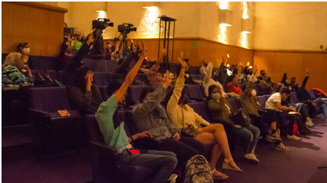
Participación del público en la conferencia performática sobre el juego. I Encuentro Internacional de Investicreación y Formación Artística. Metodologías (In)disciplinadas. Aula Magna, Centro Nacional de las Artes, Ciudad de México, junio de 2022.