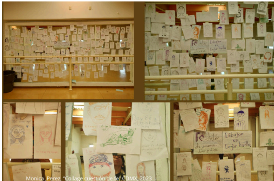
Mónica Pérez, Cuestión de fe , 2023, experiencia de aprendizaje artístico. Collage con algunas imágenes del proyecto, Universidad La Salle Nezahualcóyotl, Estado de México. Archivo de la artista.

Utiliza únicamente la luz natural del entorno y un filtro en blanco y negro para capturar la imagen.