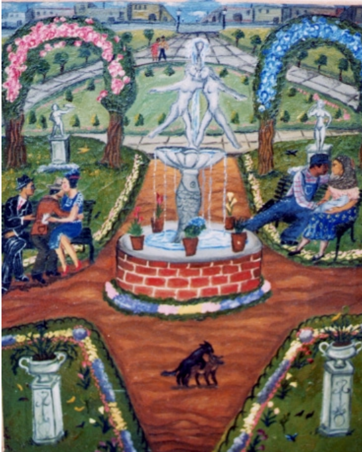
Escenas en un jardín urbano, 1936. Óleo sobre tela. Colección particular.

estaba alimentada por asuntos cotidianos, acontecimientos políticos, sociales, económicos y culturales tanto nacionales como a nivel internacional.