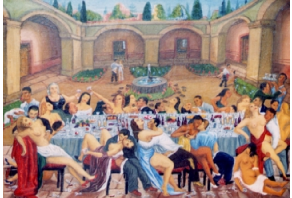
Bacanal, 1937. Óleo sobre tela. Colección particular.

Con agudeza, un humor incisivo y la estilización de los personajes, su galería de imágenes la integraron las descripciones gráficas que realizó de sus amigos,