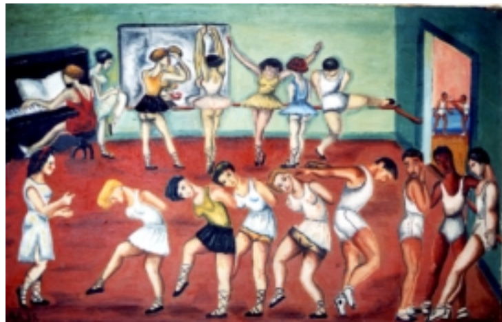
Ensayos de ballet, 1935. Óleo sobre tela. Colección particular.

▲ Palabras clave: Estilo, dibujo, inventiva, Academia de San Carlos, murales, crítica, ironía, personajes, humor, estilización, identidades fisionómicas