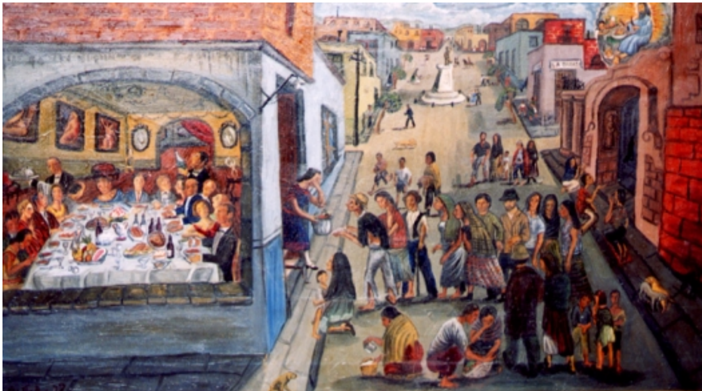
El banquete de los ricos, 1937. Óleo sobre tela. Colección particular.

co y algunos cines, en la ciudad de México y Puebla.